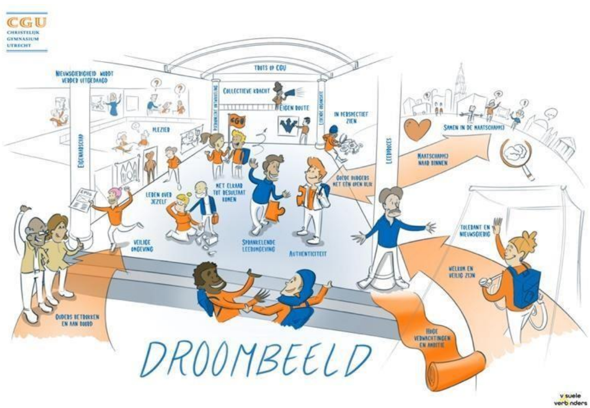
Verbeelding van het proces onderweg naar het nieuwe schoolplan